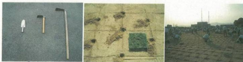
②移植鏝、小鍬(地面が硬ければ唐鍬)で深さ5cm程度の穴を掘る