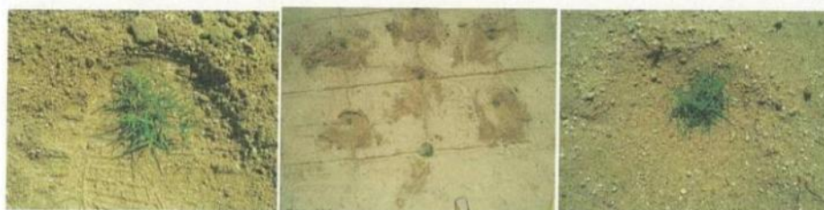
④踏みつけた後、周囲の土をポット苗の周りに戻す