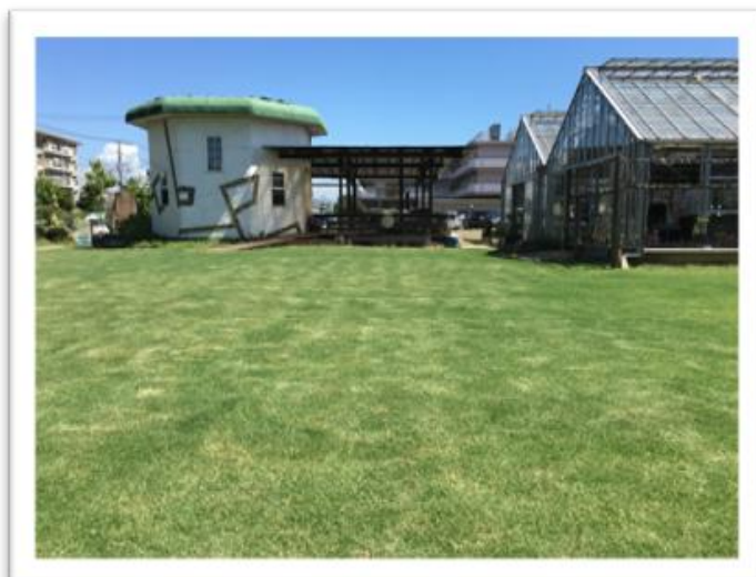
移植後約 5 ヶ月の芝生の模様 撮影日：2023 年 11 月 20 日