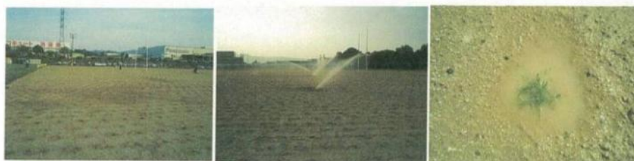
⑤移植当日はたっぷりと散水する