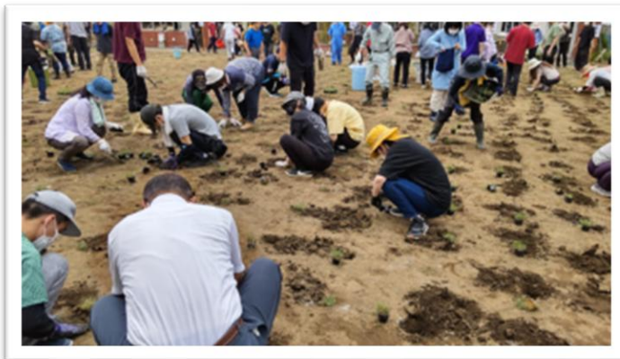
植付け時の模様 撮影日：2023 年 6 月 21 日