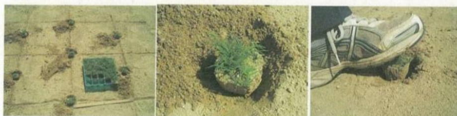
③ポット苗を1株ずつ穴に置いて、足でしっかりと踏みつける