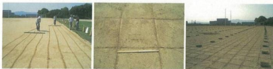
①50cm間隔にラインを引き、苗箱(25株)を配置する