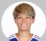
DF 南萌華 ブライトン・アンド・ホーヴ・アルビオン